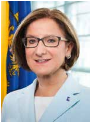
Johanna Mikl-Leitner Landeshauptfrau